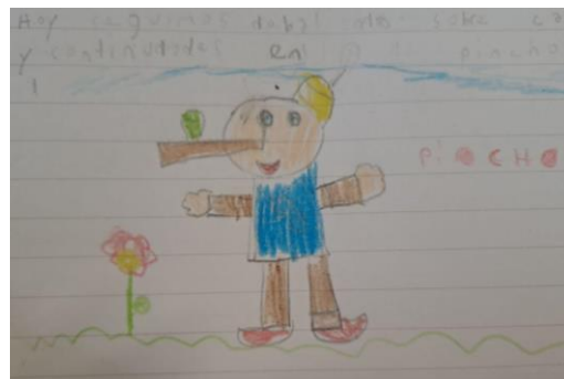
Cuento (2022). Leído en el aula